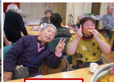
豆パンは好評でした!