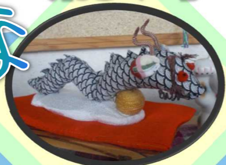
かわいい辰が夢の華の玄関 でお出迎えしております