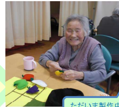
ただいま製作中です!