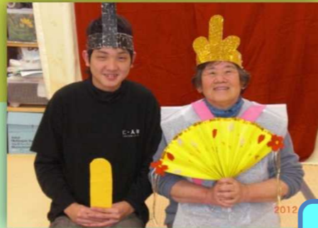
肩もみ気持ちいいわ～