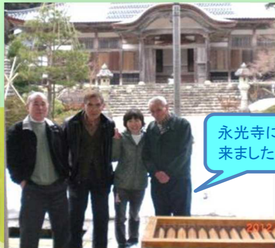
永光寺にきました!