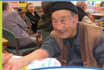
ハンドマッサージ