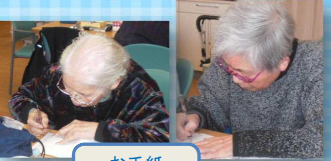
お手紙 書いてます