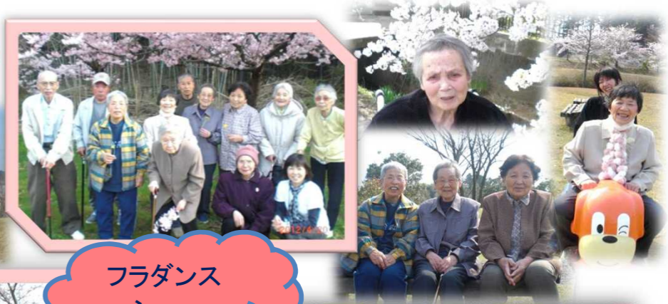
フラダンス ショー